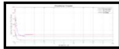
Gambar 2. Laju perubahan titik kesetimbangan bebas penyakit kasus R_0 < 1

Dari Gambar 2 menunjukkan jumlah individu yang rentan mengalami penurunan kemudian bergerak naik tetapi tidak menuju titik kesetimbangan. Pada kelas individu terinfeksi terjadi peningkatan yang setelahnya menurun karena pengobatan kemudian dan akan berkurang karena kematian alami dan kematian akan penyakit. Sedangkan pada populasi pemangsa mengalami peningkatan karena adanya mangsa yang terinfeksi tidak dapat menghindari buruan.